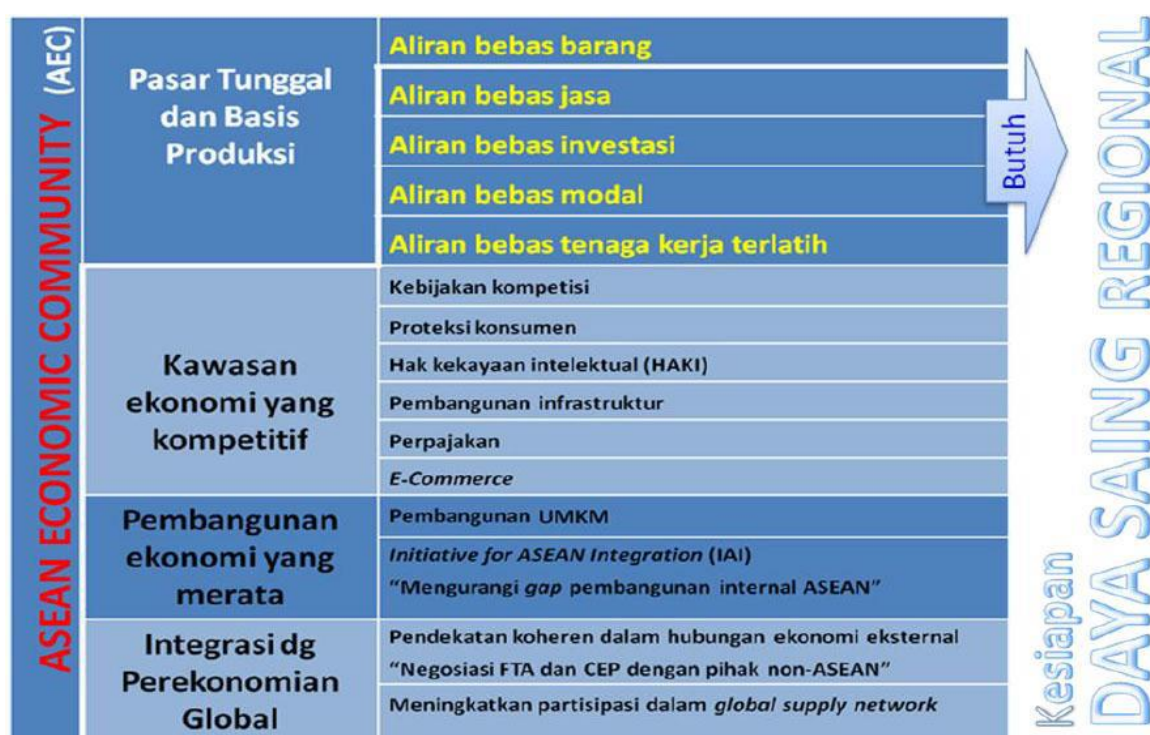
Skema Lingkup AEC 2015

Isu regional yang terkait dengan pembangunan industri dan perdagangan di Jawa Timur adalah adanya Asean Economic Community (AEC). AEC merupakan tantangan daya saing ekonomi nasional maupun Jawa Timur. Semakin terbukanya hubungan antar negara sebagai akibat kemajuan di bidang telekomunikasi dan transportasi menunjukkan adanya saling ketergantungan dan regionalisasi ekonomi berbagai negara. Posisi geografis Indonesia yang strategis menuntut adanya regionalisasi ekonomi dengan berbagai negara di sekitar Asia Pasifik, seperti AFTA, APEC dan EPA. Melalui regionalisasi ekonomi yang ada, diharapkan kinerja ekonomi Indonesia, terutama ekspor maupun impor, semakin membaik. Meningkatnya ekspor diharapkan juga mampu mendorong kinerja industri melalui meningkatnya penyerapan tenaga kerja serta daya saing industri. Selain itu, adanya integrasi Rancangan Renstra Dinas Perindustrian dan Perdagangan Kabupaten Sumenep 2016-2021 ekonomi ini menuntut adanya mobilitas faktor produksi seperti tenaga kerja (buruh) serta modal yang semakin tinggi. Dengan demikian tenaga kerja suatu negara biasbekerja di negara lain secara lebih mudah, termasuk di dalamnya kegiatan investasi antar negara. Hal ini ditunjukkan pada Gambar 3.1 berikut: Gambar 3.1