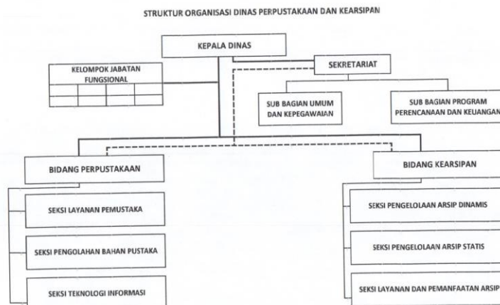
Gambar B Struktur Organisasi Dinas Perpustakaan dan Kearsipan Kabupaten Sumenep

Peraturan Bupati Sumenep Nomor 61 Tahun 2016 tentang Tugas dan Fungsi Dinas Perpustakaan dan Kearsipan Kabupaten Sumenep Dengan bagan sebagai berikut :